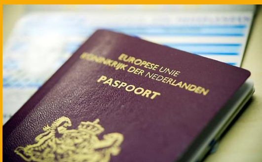
Nederlandse Ambassade te Bern