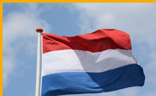
Nederlands Consulaat (H) Bazel

Copyright © 2019 Vereniging Nederland Bazel